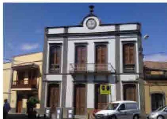
Heredad de Satautejo y La Higuera