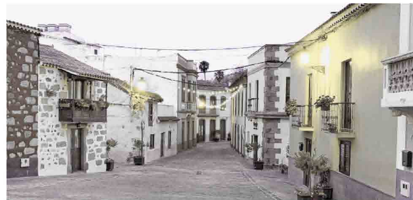
Casco histórico Santa Brígida

Por tanto, en las causas de la fundación del primitivo núcleo de Santa Brígida hay que buscar causas físicas, defensivas, económicas y de habitabilidad . Entre las primeras hay que señalar la situación en un espolón sobre el barranco, a cubierto de posibles inundaciones y en torno a una gran vega; entre las segundas la seguridad ante un ataque; entre las económicas hay que potenciar la riqueza de la zona, al estar cerca de una vega deliciosa, según opinaban quienes visitaban la zona, con muy buenas aguas, que en poco tiempo dio todo tipo de frutas y hortalizas con las que proveer a los vecinos de la zona y a la propia ciudad de Las Palmas, y la habitabilidad se le daba por descontado por los buenos aires que reinaban en el lugar, así como por el buen clima que se alternaba entre el verano y el invierno.