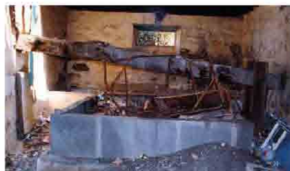
Finca Cambreleng, hijo (bodegón Vandama)