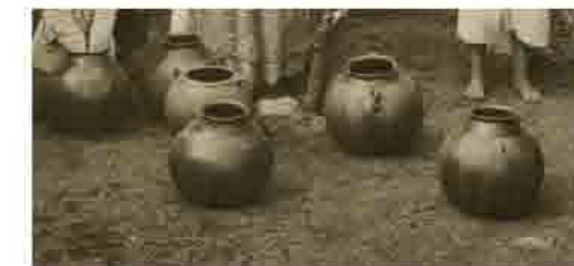
Centro Locero la Atalaya