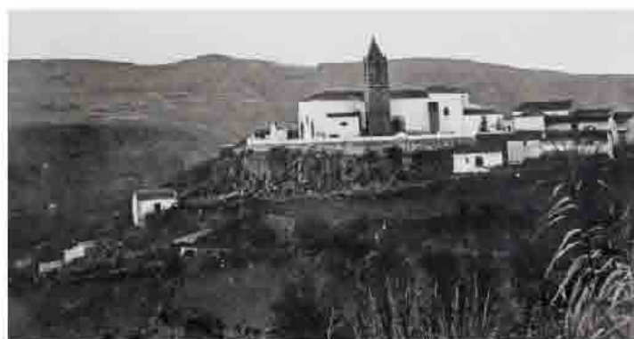
Parroquia de Santa Brígida entre 1890 - 1895

Por tanto, en las causas de la fundación del primitivo núcleo de Santa Brígida hay que buscar causas físicas, defensivas, económicas y de habitabilidad . Entre las primeras hay que señalar la situación en un espolón sobre el barranco, a cubierto de posibles inundaciones y en torno a una gran vega; entre las segundas la seguridad ante un ataque; entre las económicas hay que potenciar la riqueza de la zona, al estar cerca de una vega deliciosa, según opinaban quienes visitaban la zona, con muy buenas aguas, que en poco tiempo dio todo tipo de frutas y hortalizas con las que proveer a los vecinos de la zona y a la propia ciudad de Las Palmas, y la habitabilidad se le daba por descontado por los buenos aires que reinaban en el lugar, así como por el buen clima que se alternaba entre el verano y el invierno.