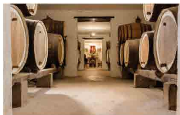
Bodega de San Juan

Santa Brígida presenta un amplio abanico de bienes cuyos ejemplos más destacados son los vinculados a la Heredad de Satautejo y La Higuera , fundada en los primeros momentos del siglo XVI (1511 -1512) destinándose buena parte del caudal al riego de los cultivos de caña de azúcar situados en el Valle de la Angostura. Esta Heredad cuenta con una importante red de distribución que tiene su sede en el mismo casco de la Villa, donde se levanta la Casa de Agua, sobre un conjunto de cantoneras que recibían el nombre de La Alcantarilla. La Casa de Agua cuenta con un reloj en la parte alta del inmueble que sirvió para el reparto de agua de los agricultores de la zona.