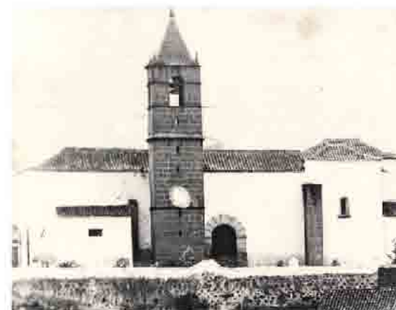
Costado sur de la Iglesia de Santa Brígida en siglo XIX

En este clima, de desconcierto ante la destrucción por el fuego y de indefinición estilística por el exceso de tendencias a las que se puede recurrir, la Arquitectura religiosa que en estos años se hace o se reconstruye en la Isla de Gran Canaria acusará el mismo desconcierto y la misma indefinición. La actual Iglesia Parroquial de la Villa de Santa Brígida es ejemplo de ambas cosas.