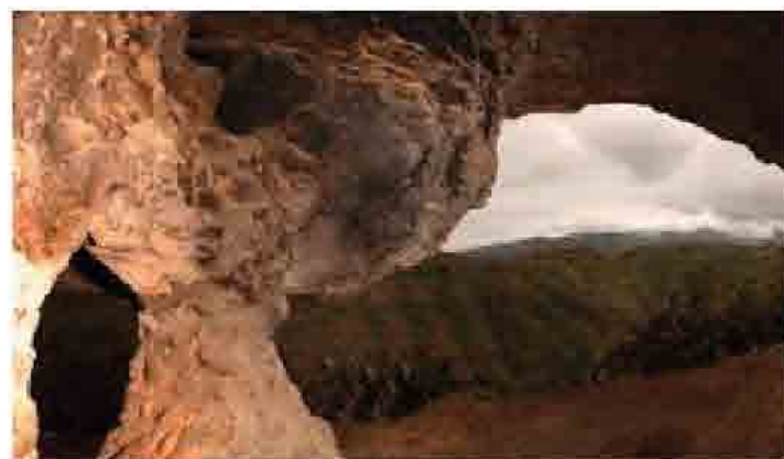
Cueva del gato - Los corrales

La Cueva del Moro se trata de un conjunto arqueológico, formado por un total de ocho unidades, de las cuales siete de ellas corresponden a silos excavados en el suelo de varios solapones naturales, y la última se trata de una cueva de habitación. La morfología de los silos varía entre las formas circulares y ovales, encontrándose en el interior de estas pequeñas cazoletas de morfología circular y de pequeñas dimensiones, que pudieran tener la funcionalidad de recoger, tras ser tapada con una laja, las posibles filtraciones. En la actualidad estos silos se encuentran rellenos de tierra.