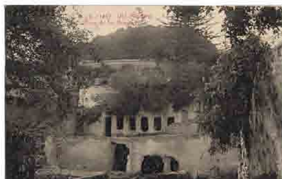
Las Cuevas de Los Frailes

La Cueva de Los Frailes , situada junto al puente de la Calzada, y excavadas en el volcán de la Caldereta, está formado por un total de 21 cuevas naturales que presentan ciertas huellas de retoques artificiales, y que fueron utilizadas como lugares de hábitats. Las cuevas se encuentran distribuidas en diferentes niveles a lo largo del terreno y presentan morfología y dimensiones muy variadas. Según D. José Naranjo, en algunas de las cuevas más amplias, existían depósitos tanto para el agua como para el grano. El nombre de estas cuevas proviene de la posible ocupación de éstas por dos monjes castellanos, Juan de Lebrija y Diego de Las Cañas que en 1484 intentaron cristianizar a los canarios alzados, muriendo en el intento.