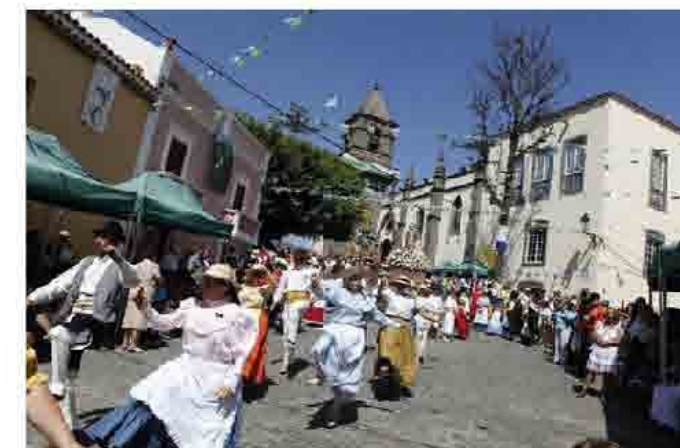
Actual Iglesia Parroquial de la Villa de Santa Brígida + fiestas tradicionales